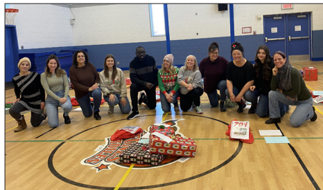
Photo de l'équipe d'enseignantes et d'enseignants bénévoles des écoles Ste-Germaine-Cousin, St-Vincent-Marie et Ste-Gertrude qui ont fait le tri des cadeaux le 14 décembre dernier.